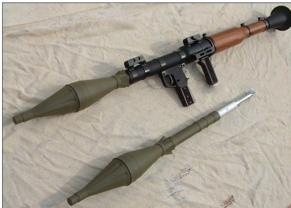
11) Lanzacohetes RPG-7. Se llegó a usar en combates del narcotráfico, aunque con poca presencia. 74

metralla; 71 al quitar el seguro de la granada se tiene determinado tiempo en segundos para poder arrojarla antes de que explote. Los lanzagranadas son aquellos que disparan granadas de 40 mm, las cuales pueden ser de diferentes tipos cómo las no letales, 72 explosivas o de señalización 73 a varios cientos de metros de distancia (Holmes, 2008: 343 – 345).