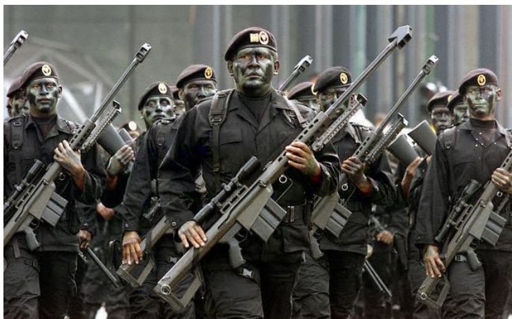
10) Elementos del grupo aeromóvil de fuerzas especiales (GAFE) del ejército mexicano con Barretts M82 68 .

Los corridos alterados también se encargaron de hacer mención al rifle Barret M82, desde el hecho de describirlo como aquella arma que solo llegaban a usar en los momentos en que tenían que salir de donde estaban, hasta crear un corrido como el siguiente, cuyo eje temático es exclusivamente dicha arma. En cuanto a sus características, su nexo con los francotiradores e incluso hasta una alegoría entre el arma concebida como un “zopilote prieto”: