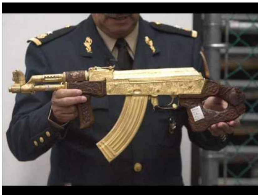
6) AK-47 bañado en oro y con modificaciones en la culata y parte del cañón, que fue incautado por el ejército mexicano 59 .