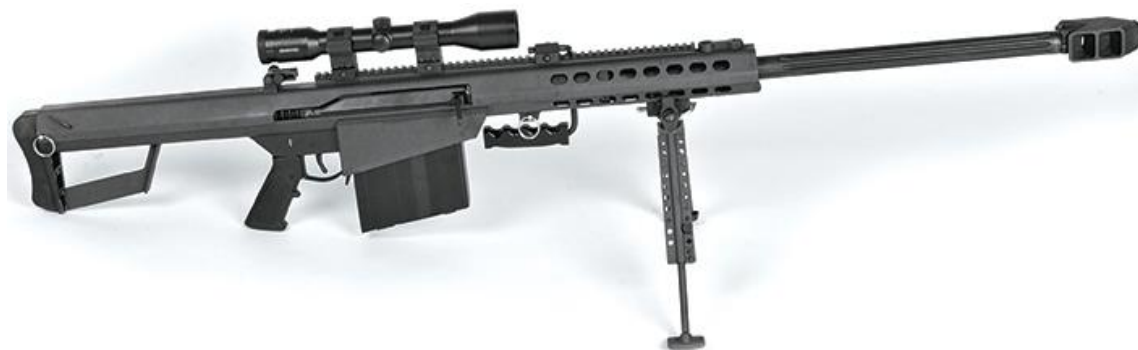
9) Barret M82 67 .

Por otra parte, durante la guerra contra el narcotráfico se empezó a usar uno de los rifles para francotirador más poderosos sobre el que se tenga registro; 66 se trata del rifle Barrett M82, ver imagen 9, el cual dispara una munición calibre .50mm, que tiene un alcance efectivo de dos kilómetros, y es capaz de traspasar cualquier clase de blindaje y su cargador es de diez cartuchos (Holmes, 2008: 321). Inicialmente los grupos criminales fueron los primeros en usar en México este rifle, después del ejército mexicano, ver imagen 10. Cabe mencionar que los narcotraficantes que lo emplearon, desde el inicio de la guerra contra el narco, fueron “El Chino Ántrax” y “El Macho Prieto”; a este último en varios corridos se le mencionó usando el Barrett en los diferentes ataques que realizó.