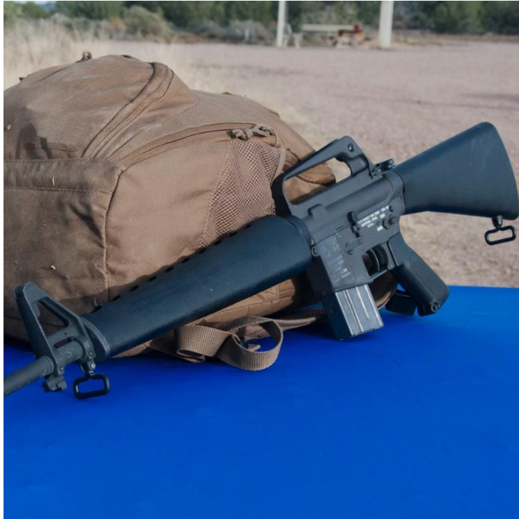
7) AM16A-1 en su modelo inicial con cachas, culata y cañón recubierto de plástico. 60