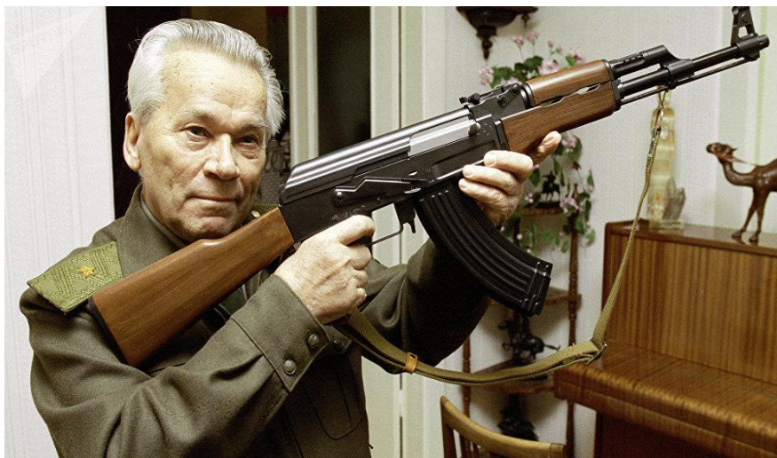
5) Fusil AK-47 con su inventor Mijaíl Kalashnikov. 58