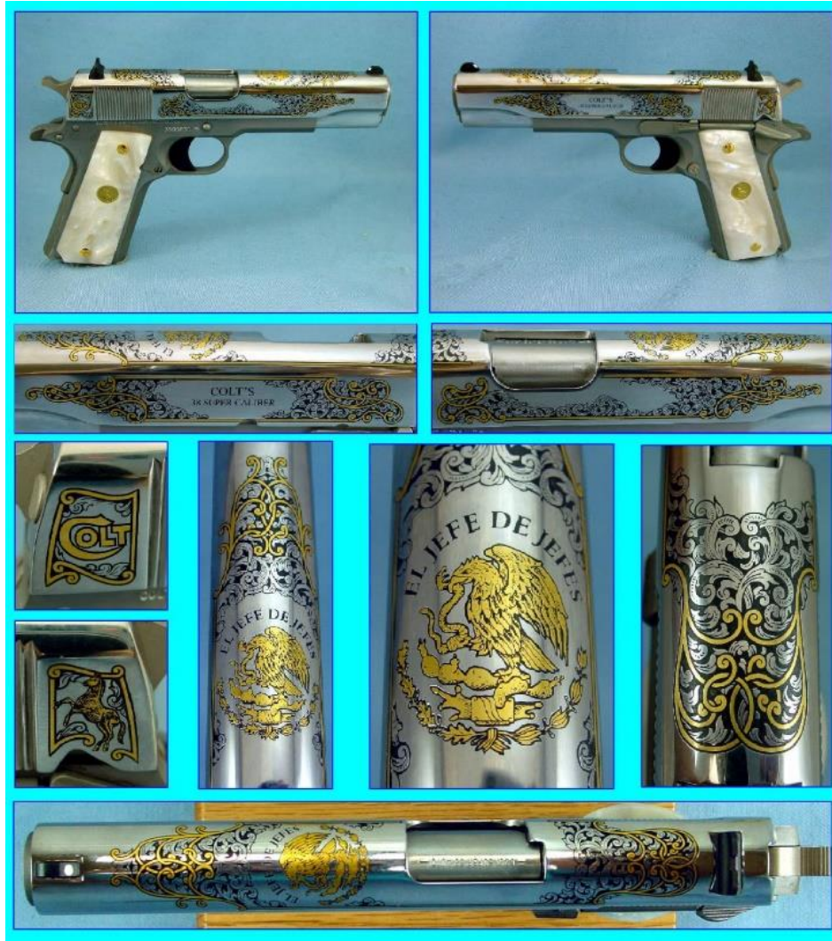
3) Colt modelo 1911 calibre .45, cuenta con el águila real mexicana y la frase “Jefe de jefes”, que hace referencia al corrido de “Los Tigres del Norte”. 50